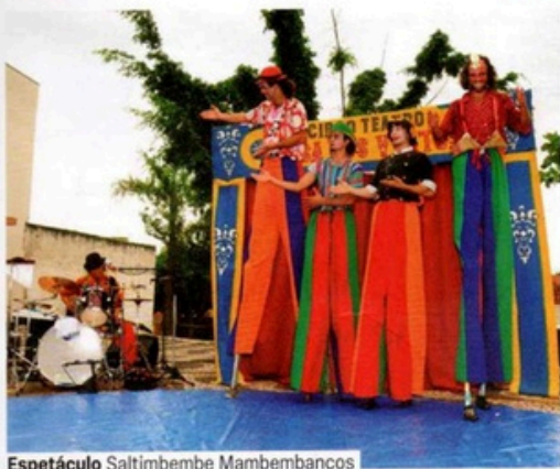
Espectáculo Saltimbembe Mambembancos